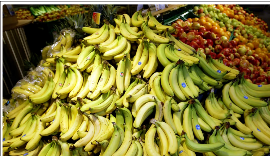
En svampsjukdom vid namn TR4 hotar världens bananodlingar.

Under den första halvan av 1900-talet drabbades de stora odlingarna av Gros Michel av en sjukdom som höll på att utrota sorten helt, den så kallade panamasjukan . Panamasjukan orsakas av en svamp som angriper bananplantans rötter och gör att den inte får någon näring. Det leder till att den så småningom dör. Det finns än idag inget botemedel mot panamasjukan. Svampen kan finnas kvar i jorden bland de angripna plantorna och sprida sig i både jord och infekterade växtdelar. Det går alltså inte att odla banan på de marker där panamasjukan härjat.